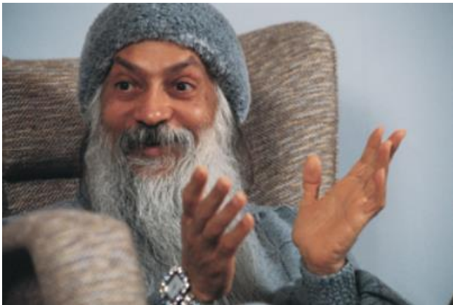
Osho - Poona India augustus 1974

Als iemand met zijn je leidt, val je nooit in de put. Dan word je in een andere dimensie geboren, en is het langer van geen waarde opnieuw in deze wereld geboren te worden. Je verdwijnt van hier, je verschijnt ergens anders. Dat ergens anders is God, dat ergens anders is nirwana .